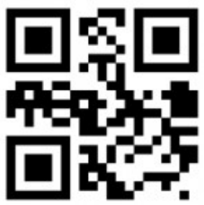
Qr-code (04 66 05 10 10)